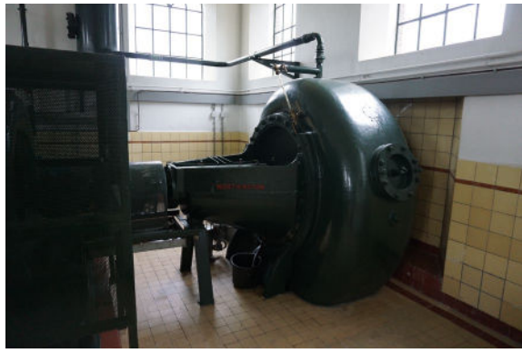
De oostelijke pomp