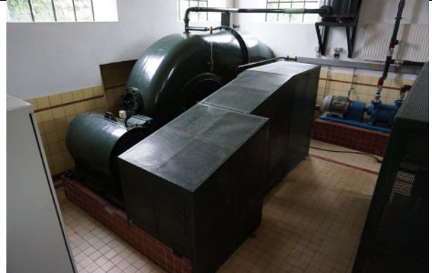
De westelijke pomp met motor