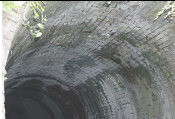
Gemetseld gewelf zuidelijke instroombak