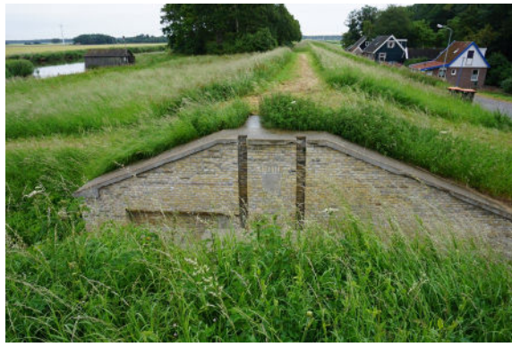
Waterdoorlaat oostelijke wand met jaartalsteen