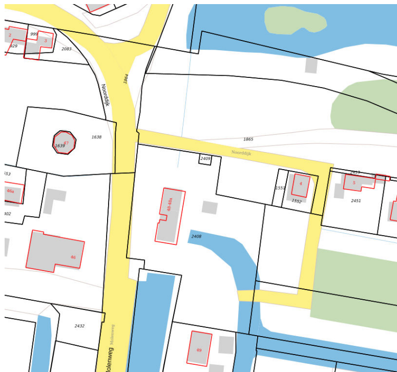
Kadastrale kaart situatie (augustus 2019)