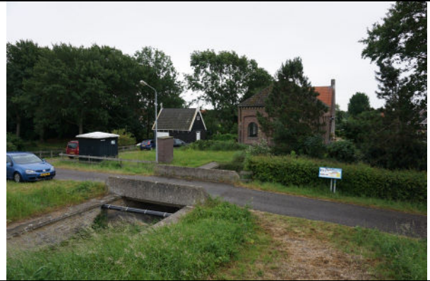
Betonnen vaste plaatbrug over doorlaat