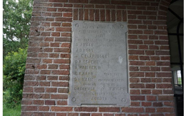
Herdenkingssteen uit 1871 in zuidgevel