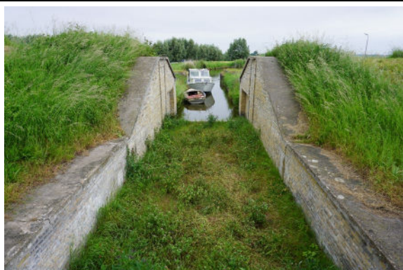
Waterdoorlaat (zicht naar noorden)