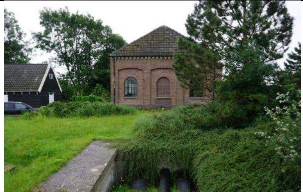
Waterdoorlaat (zicht naar zuiden)