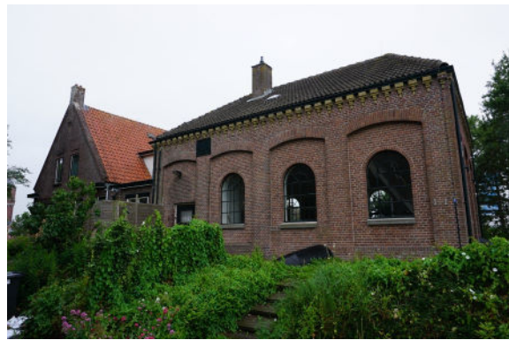
Oostgevel gemeaal (dienstwoning links)