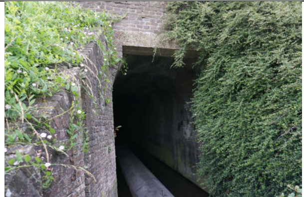
Een van de zuidelijke instroombakken