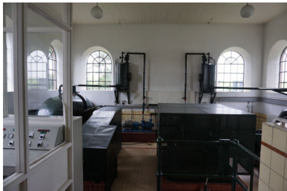
Overzicht machinehal over middenas