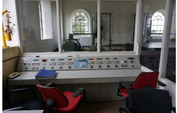
Later geplaatst bedieningspaneel