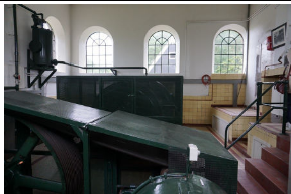
Zicht op de twee pompinstallaties