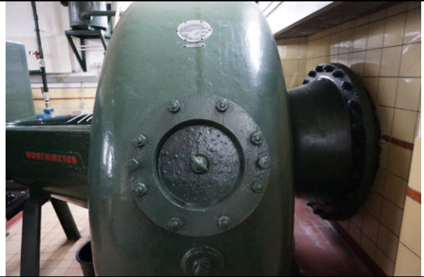
Detail oostelijke pomp