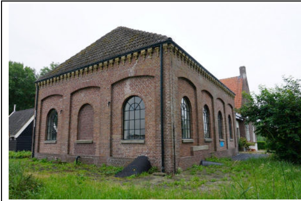
Noordgevel (links) en westgevel (rechts)