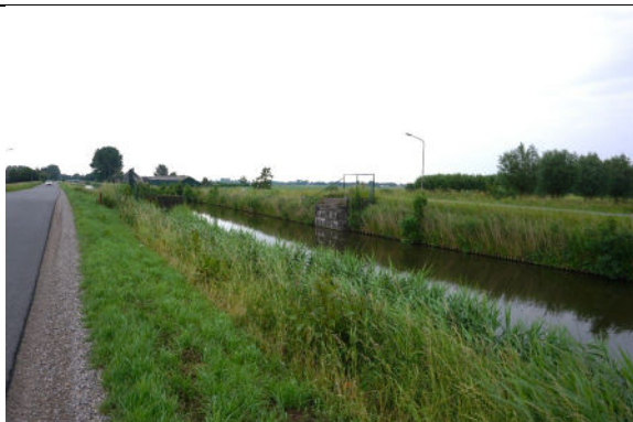
Ligging langs Langereis