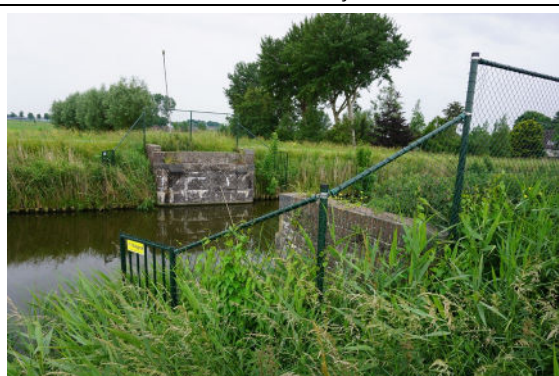
Zicht naar noordoostzijde