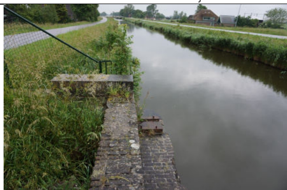
De uitbouw (rechts) met een van de voetplaten aan zuidoostzijde