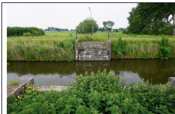
Zicht vanaf landhoofd (noordwest) naar landhoofd aan zuidoostzijde