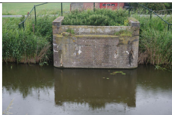
Landhoofd aan noordwestzijde