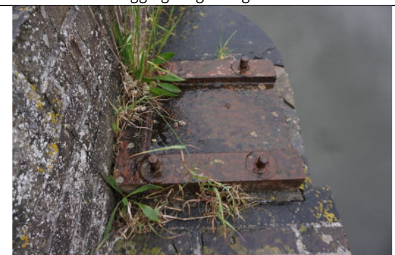
Een van de voetplaten aan zuidoostzijde