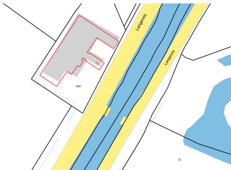
Kadastrale kaart situatie (juni 2019)