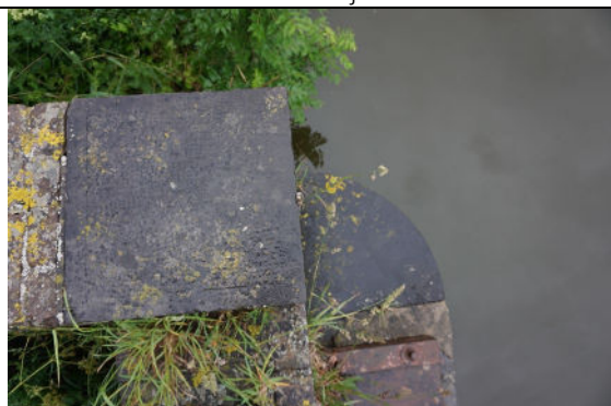
Hoekstenen aan zuidoostzijde