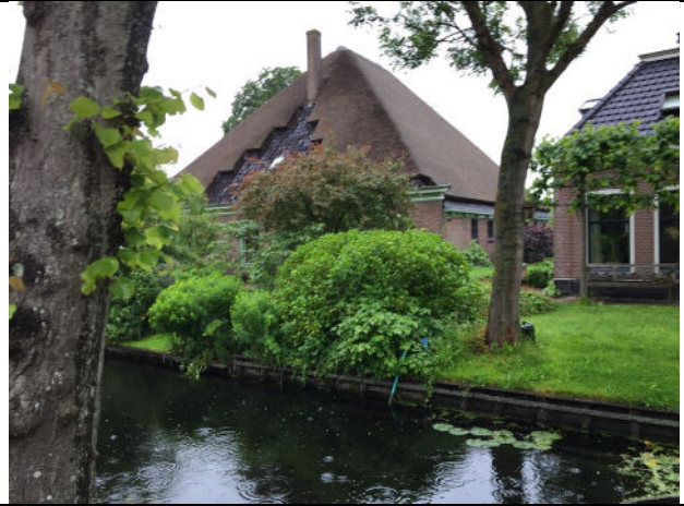
Voorzijde (links) en noordoostgevel (rechts)