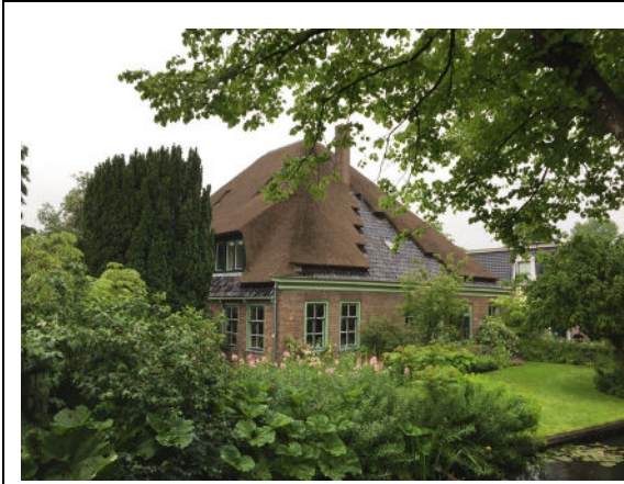
Voorgevel (rechts) en linker zijgevel (gedeeltelijk)