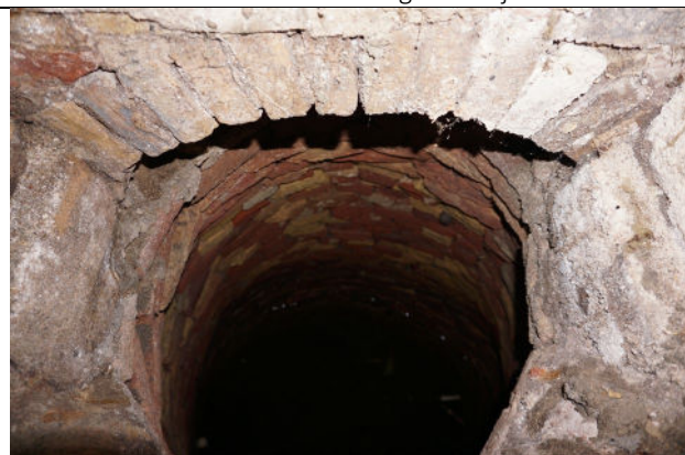
Toegang tot gemetselde waterkelder onder stolp