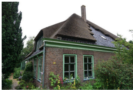
Voorgevel (gedeeltelijk, rechts) en linker zijgevel