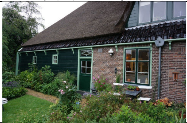
Zuidwestgevel met houten wand