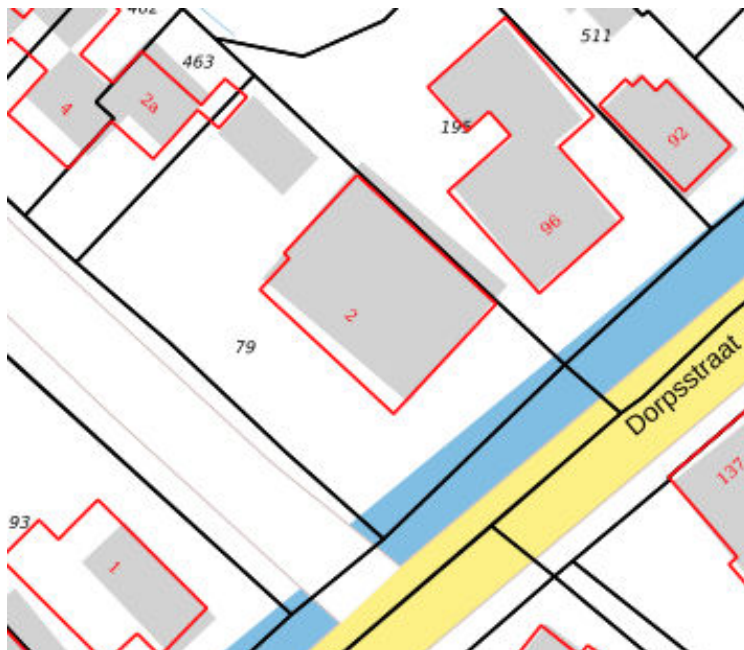
Kadastrale kaart situatie (juli 2019)