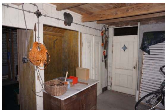
Houten wand langs vierkant (noordwest zijde)