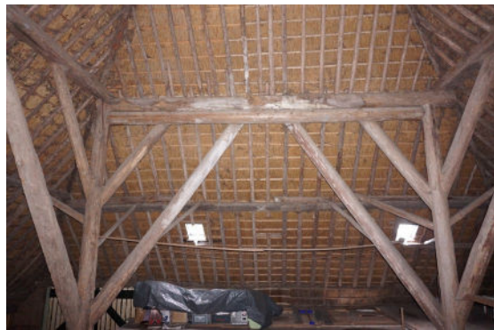
Deel van gebint