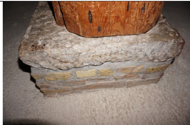
Voet van een van de gebintstijlen