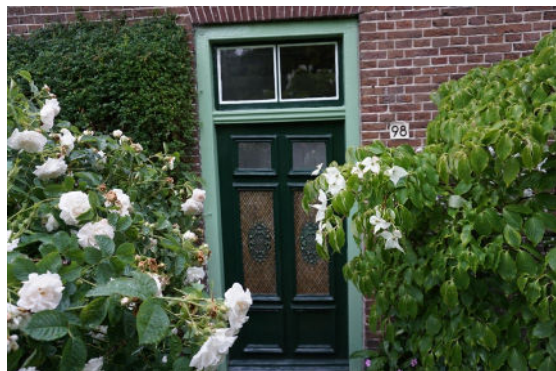
Deur in voorgevel