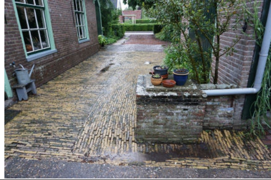
Regenwaterput naast stelp