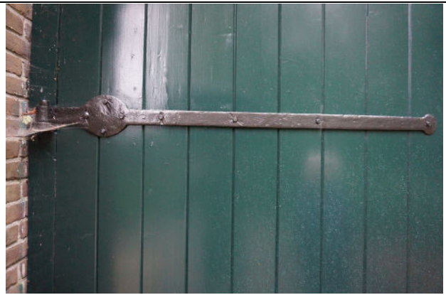
Een van de scharnieren van darsdeur