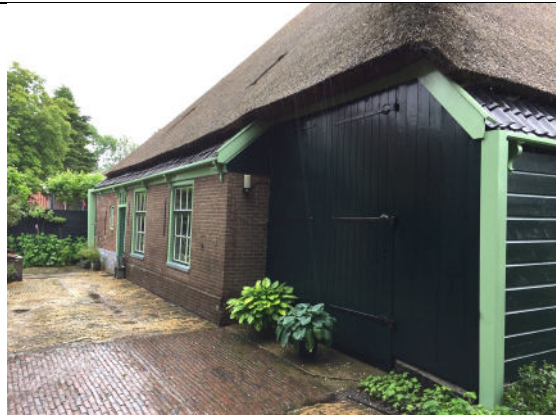
Noordwestgevel met darsdeur (rechts)