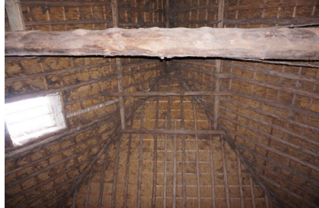
Nok van kap