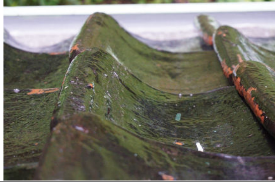
Rand van Hollandse pannen