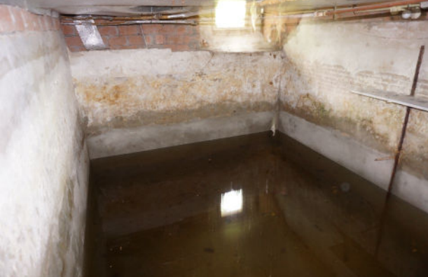
Kelder aan noordwestzijde