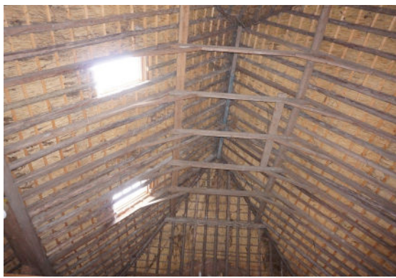
Nok van kap, zicht in lengterichting