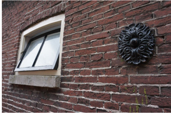
Stalvenster en rozet in linker zijgevel