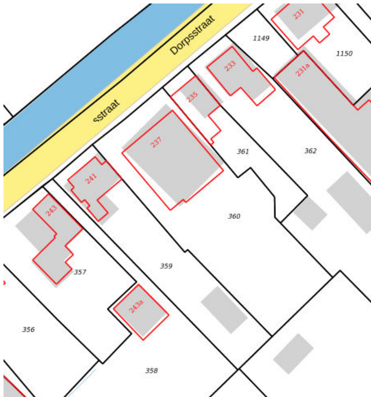
Kadastrale kaart situatie (juni 2019)