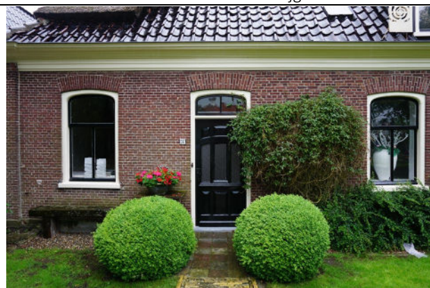
Deur in voorgevel