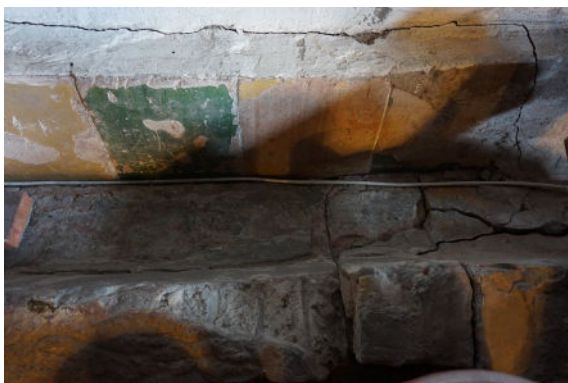
Betegelde lage drinkgoot koestal