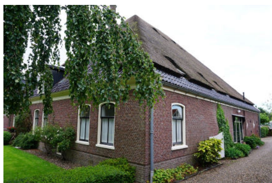
Rechter zijgevel en deel van voorgevel (links)