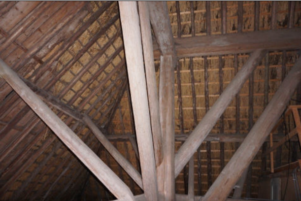
Een van de gebintstijlen