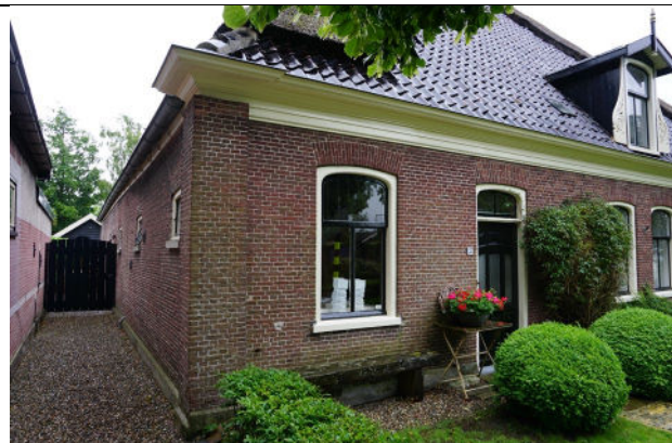
Linker zijgevel en deel van voorgevel (rechts)