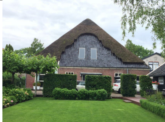
Achtergevel vanuit tuin