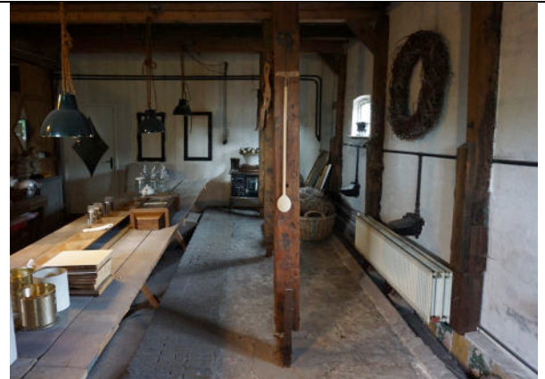
Koestal, richting noordwest