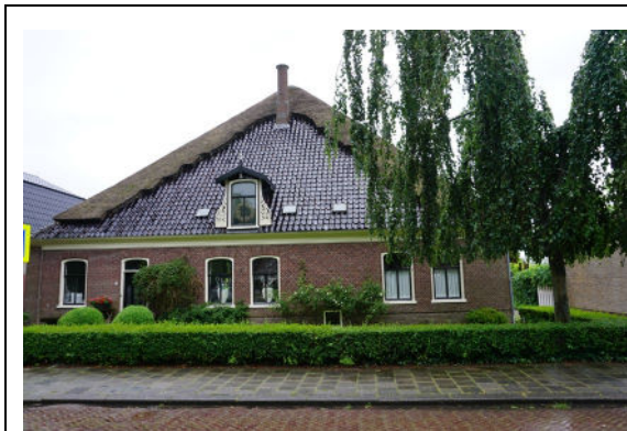
Voorgevel aan Dorpsstraat