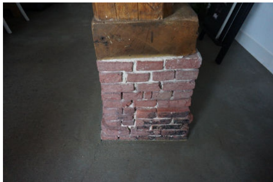
Voet van een van de gebintstijlen