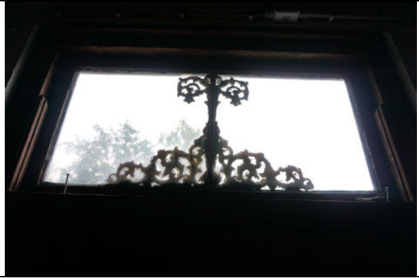
Levensboom in bovenlicht bij koestal