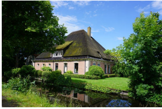
Zuidoostgevel aan vaarsloot