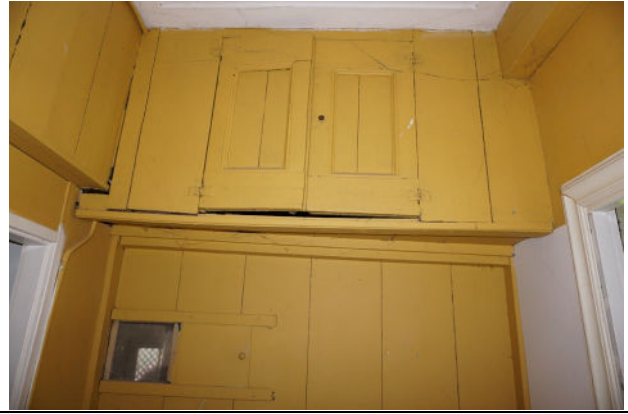
Houten wand met luikjes