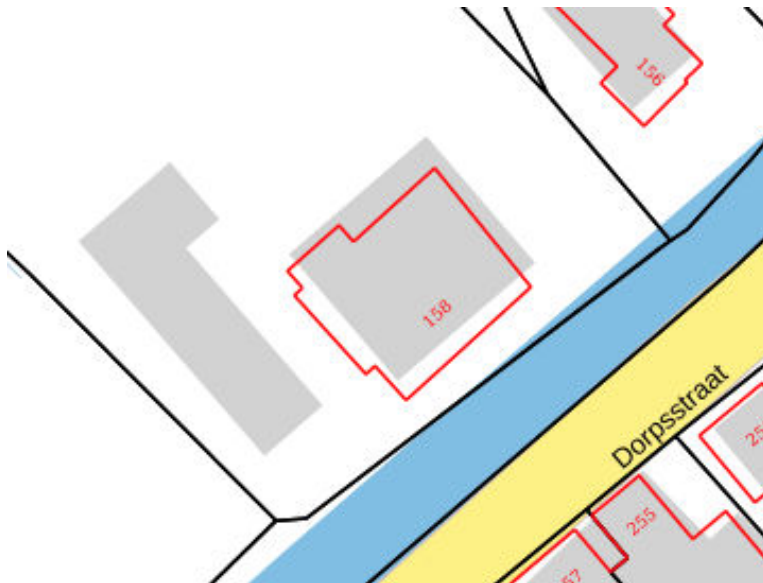
Kadastrale kaart situatie (juni 2019)