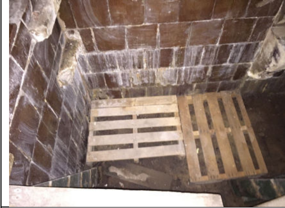
Betegelde kelder (met tijdelijke vlonders)