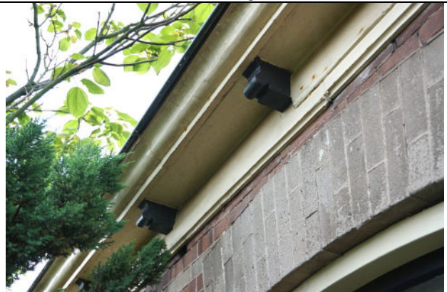
Detail met gootklossen aan noordoostgevel