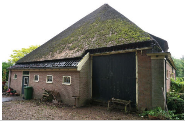
Zuidwestgevel met de darsdeuren