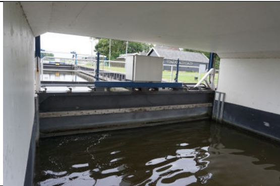
Zicht naar schutkolk (vanuit westen)