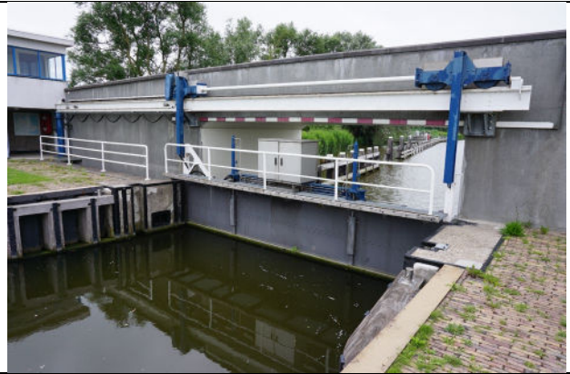
Westelijke roldeur (gesloten) bij brug