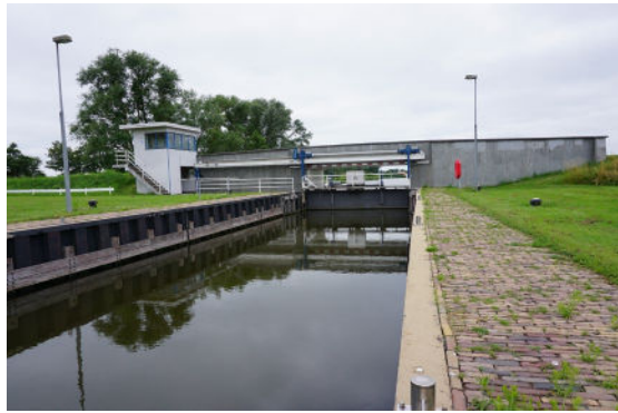
Schutsluis, brugwachtershuisje en brug