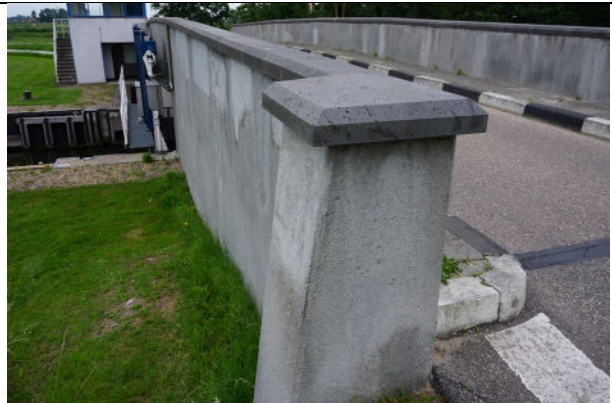
Detail vaste brug