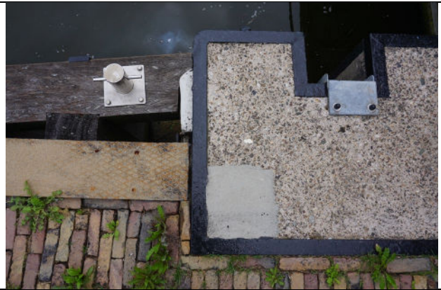
Detail schutbalkengleuf in betonnen kade