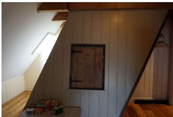
Toegang tot rookruimte in (afgetimmerde) schoorsteen