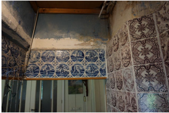
Enkele bijbelse voorstellingen binnenzijde schouw