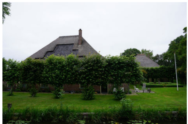
Zicht vanaf de Heerenweg