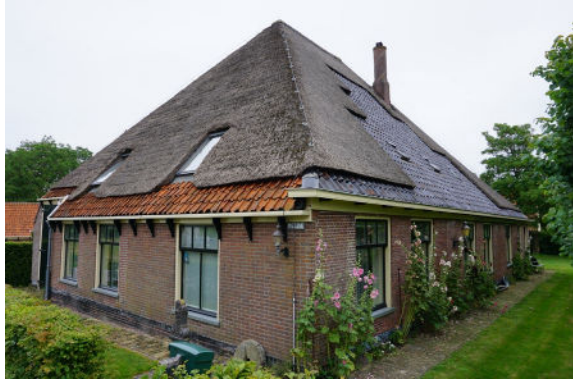
West- en zuidgevel