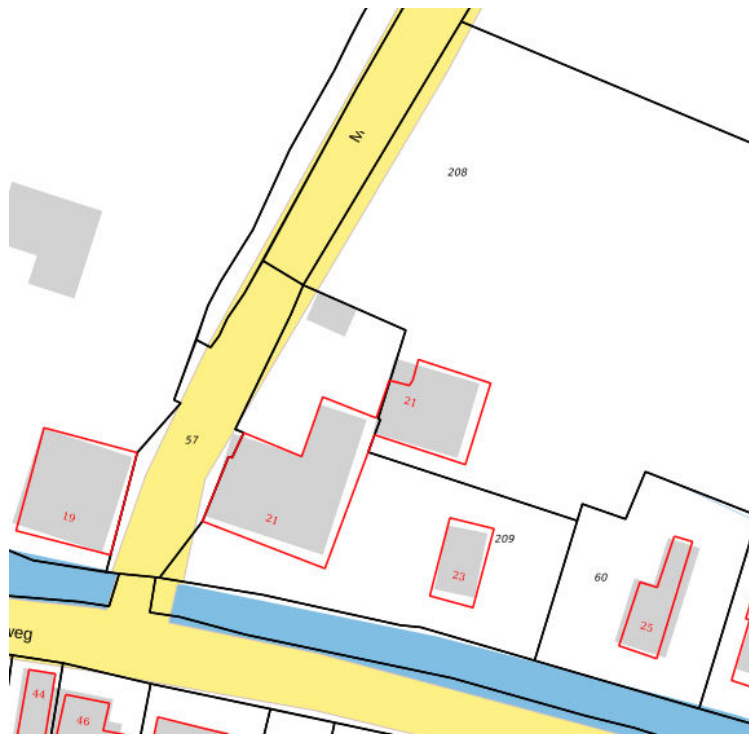
Kadastrale kaart situatie (augustus 2019)